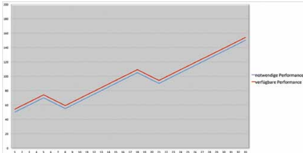
Abbildung 3: Flexible Leistungsbereitstellung in der Public Cloud

Neben dem im Vergleich zur Neu-Implementierung deutlich günstigeren Weg der Virtualisierung lassen sich so gleichzeitig alle Vorteile der Cloud-Architektur für Legacy-Anwendungen nutzen.