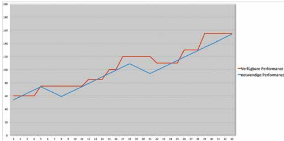
Abbildung 2: Schematische Darstellung der Leistungsbereitstellung in vielen realen IT-Situationen

ren, wenn nicht sogar – wie in diesem Falle – seit Jahrzehnten etablierte und betriebene Software auf moderne IT-Infrastrukturen zu portieren, weil es im Jahre 2012 beim besten Willen keinen Support und keine Ersatzteile mehr für Technologien aus der Mitte der neunziger Jahre des letzten Jahrhunderts zu kaufen gibt.